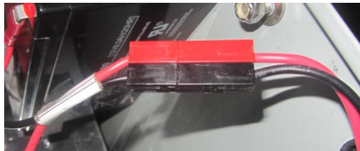
Hình 2: Giắc cắm Battery trong tủ điều khiển FXD